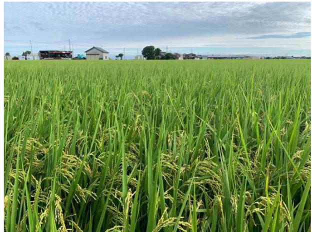
早生のうるち米 ちほみのり