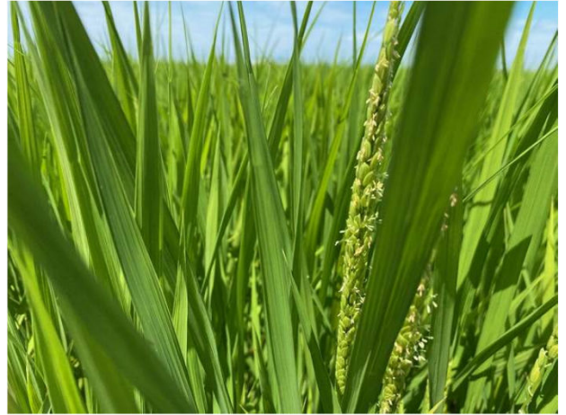
コシヒカリの穂が出始めました

二十四節気 立 秋 りっしゅう -秋の気配を感じる頃 暦の上ではこの日が暑さの頂点となります