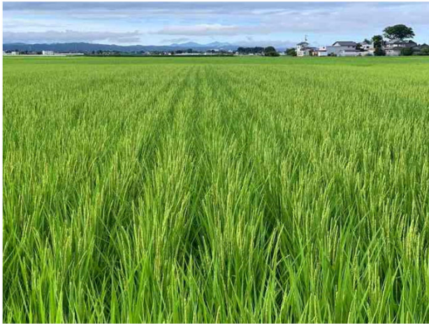
コシヒカリの穂が出揃いました