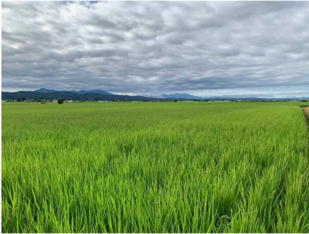
真保さんの田んぼ