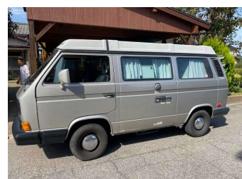
フォルクスワーゲン ヴァナゴン