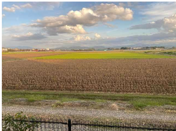
弊社工場裏の大豆畑もそろそろ..

二十四節気 霜降 そうこうー 露が冷気によって霜になり降り始める頃 紅葉が始まります