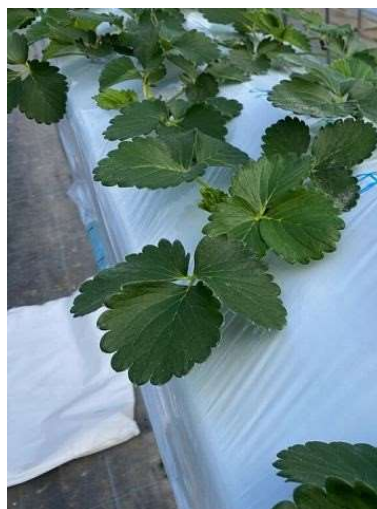
ハウス栽培の越後姫

稲刈りを終えて、農家の皆さんは冬に収穫する作物の準備に取り掛かっています。生産法人では、冬にビニールハウスでいちごの越後姫や春菊を収穫します。越後姫は、稲刈りが終わったあたりから、定植を始めて、クリスマス頃から年明け頃に収穫が始まるようです。