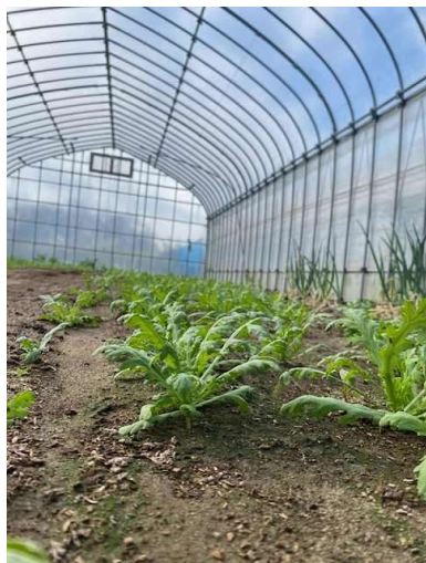
ハウス栽培の春菊