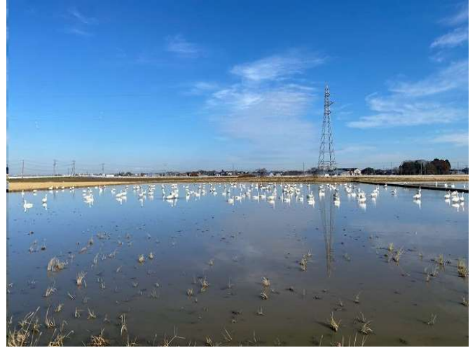
田んぼには白鳥がたくさん来ています

二十四節気 大雪 たいせつー 山の峰々は雪をかぶり平地にも雪の降る頃 南天の実が赤く色づいています