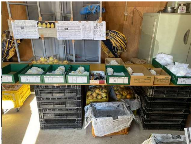
出荷作業は続きます