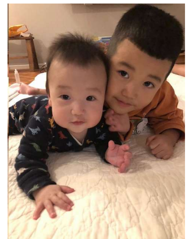
クリスマスプレゼントを待ちながら

既に仙台の祖父母や、私と妻の実家からプレゼントをもらっていますが、我が家からのプレゼントはクリスマスの早朝にツリーのところへ置くので、毎日ソワソワしている様子の長男です。