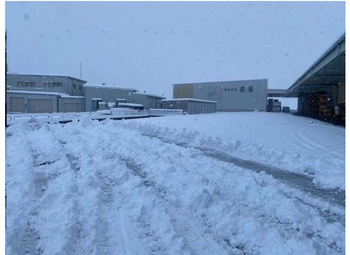
当社工場敷地内も40cm以上の積雪

二十四節気 冬至 とうじー 一年中で最も夜が長い日 これから一日一日 日が伸びていきます