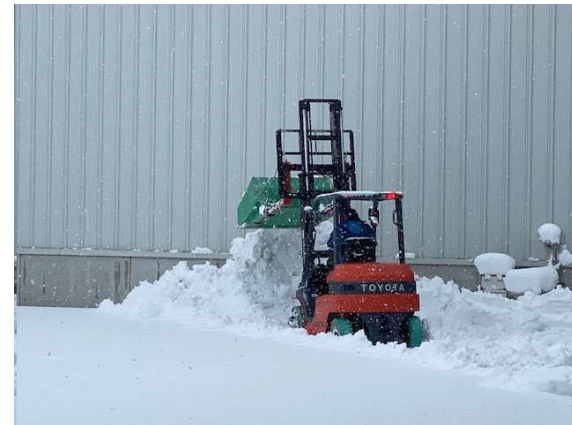
今冬初めての除雪作業

先週の日曜日から雪が降り始めました。 今週の天気予報は、ずっと雪マークでした。 昨日今日強い寒波の影響で大雪となっています。 12月に入っても暖かい冬でしたが、その帳尻を合わせるかのような天候となっています。 今朝も駐車場には40cm以上雪が積もっており、社員で協力して雪かきを行いました。 幸いにも来週の月曜日からは気温が高く、雨の日が続くので積もった雪が溶けてくれると思います。